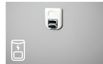
Szenario B: fix montierte Wandladestation mit Dose