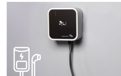
Szenario C: Wandladestation mit fest angeschlagenem Kabel