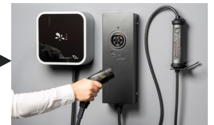
► JUICE BOOSTER 3 air + Wallbox-Adapter