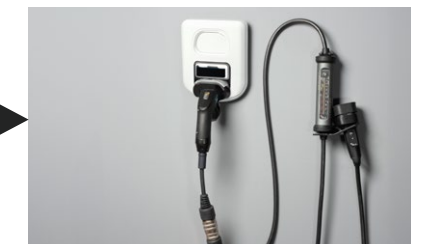
► JUICE BOOSTER 3 air + Typ-2-Adapter