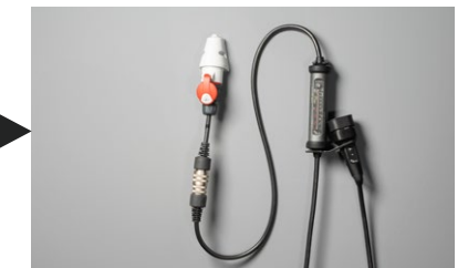
► JUICE BOOSTER 3 air + passenden Adapter