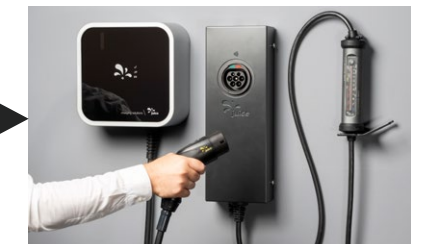
► JUICE BOOSTER 3 air + Wallbox-Adapter