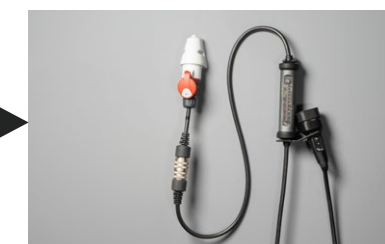
► JUICE BOOSTER 3 air + adaptateurs inclus