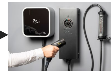
► JUICE BOOSTER 3 air + adaptateur de borne de charge murale