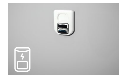
Scenario B: stazione di ricarica fissa montata a parete con presa