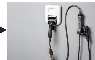
► JUICE BOOSTER 3 air + adattatore di tipo 2