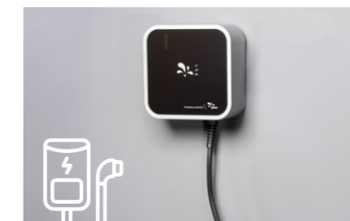
Scenario C: stazione di ricarica a parete con cavo fisso