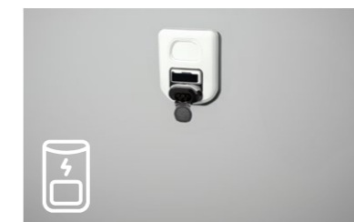
Scenario B: stazione di ricarica fissa montata a parete con presa